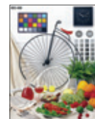
*3 fotografie Jízdní kolo

Poznámka k rychlosti tisku: Rychlost tisku se může lišit podle podmínek.